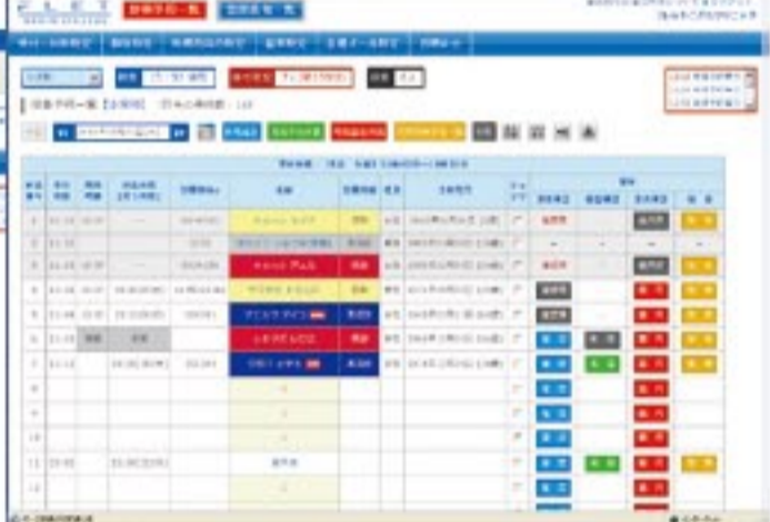
↑管理画面は順番予約、時間予約ともにわかりやすい色分けで一覧表示。簡単な操作でデータの更新ができる