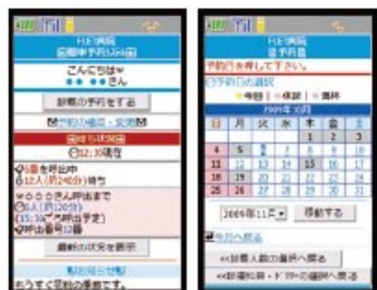
↑利用者は携帯から名前と生年月日を一度登録するだけで、次回からはID・パスワード、診察券番号などの入力をせずに利用が可能。順番予約トップ画面では、待ち状況を画面下に表示。時間予約は1カ月のカレンダーから予約日を選択できる